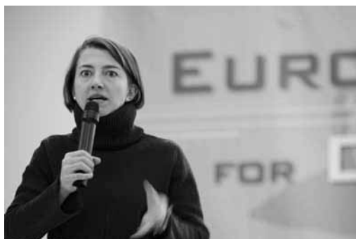
Une représentante de l'EUMC à la Conférence de la Jeunesse à Berlin.

L'EUMC a continué à participer à des conférences et à des événements soutenus par la direction générale Emploi, affaires sociales et égalité des chances. L'EUMC a apporté sa contribution au séminaire sur les Roms dans l'Europe élargie , à la suite de la publication du rapport intitulé Roma in the enlarged Europe (Les Roms dans l'Europe élargie).