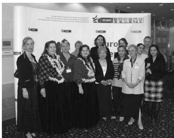
La Table ronde de l'EUMC avec le Réseau International de Femmes Roms.

En mars 2005, l'EUMC a organisé une table ronde avec le Réseau international des femmes roms. La réunion avait pour objet de faciliter l'autonomisation des femmes roms par le biais d'initiatives locales. L'EUMC a également intégré le dialogue avec les femmes roms dans son dialogue élargi avec la société civile, c'est-à-dire la conférence européenne des tables