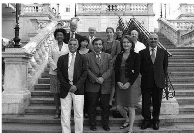
Les participants de la réunion commune entre l'EUMC et l'EESC en 2005.

pour la période 2005-2006. L'EUMC a également contribué au travail du CES dans d'autres domaines, comme les femmes et la pauvreté, le programme de La Haye et la proposition relative à l'Agence des droits fondamentaux.