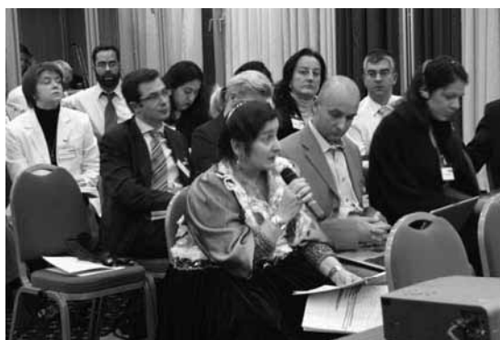
Participants à la Table ronde européenne de l'EUMC.

Cette rencontre a rassemblé une cinquantaine de participants représentant la société civile, des ONG, des partenaires sociaux, des agences spécialisées, des organisations