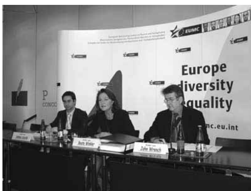
La directrice de l'EUMC, Mme Beate Winkler présente le rapport à la presse.

Le rapport intitulé Policing Racist Crime and Violence (Le contrôle policier de la criminalité et de la violence d'inspiration raciste) a été publié en septembre 2005. Les auteurs du rapport constatent que la majorité des États membres ont des réponses policières inadéquates à la violence et à la criminalité à caractère raciste, un seul État membre disposant d'une approche policière complète. Le