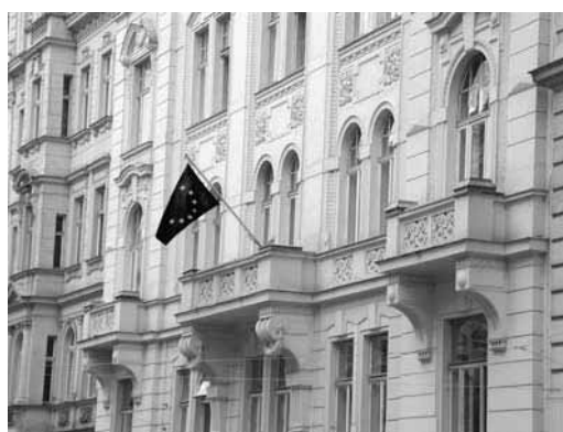
Le bâtiment de l'EUMC à Vienne

La principale fonction de l'EUMC est de contribuer au développement d'une formulation efficace des politiques, tant au niveau européen qu'au niveau des États membres. L'EUMC a pour but d'aider l'UE et les États membres à mettre au point des politiques concrètes permettant de contribuer à la lutte contre le racisme et la discrimination qui en découle et de soutenir