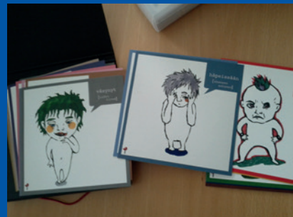
Kouvola, Suomi. Lapsen ikää ja kehitystasoa vastaavaa lasten kuulemisessa käytettävää materiaalia.