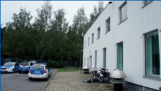
Eesti. Eraldi sissepääs Tartumaa Ohvriabikeskuse hoone tagaküljel.

Tartumaa Ohvriabikeskus Eestis on loonud eriti traumeeritud lastele hoone tagaküljele eraldi sissepääsu. Mõnes Soome kohtusaalis on samuti eraldi sissepääsud ning eraldi sissepääsud ja ooteruumid on ka Ühendkuningriigi kohtutes kõrgelt hinnatud.