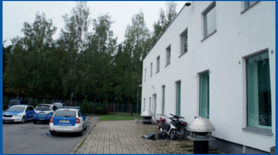
Εσθονία. Χωριστή είσοδος στο πίσω μέρος του κτιρίου του κέντρου υποστήριξης θυμάτων της Tartumaa.

Το κέντρο υποστήριξης θυμάτων της Tartumaa ( Tartumaa Ohvriabikeskus ) στην Εσθονία διαθέτει ειδική είσοδο στο πίσω μέρος του κτιρίου του για παιδιά με σοβαρά ψυχικά τραύματα. Κάποιες δικαστικές αίθουσες στη Φινλανδία επίσης διαθέτουν χωριστές εισόδους, ενώ οι χωριστές εισοδοί και αίθουσες αναμονής αποτελούν ιδιαίτερα θετικό γνώρισμα των δικαστικών κτιρίων του Ηνωμένου Βασιλείου.