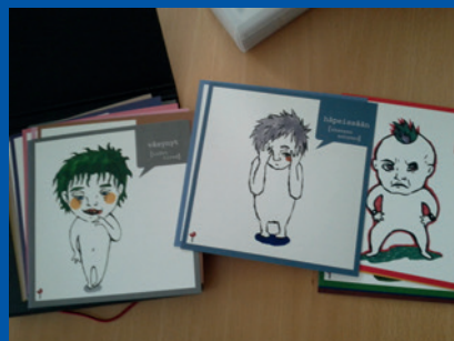
Finland, Kuovola. Materiale, der anvendes under afhøringer af børn, afhængigt af deres alder og udvikling.