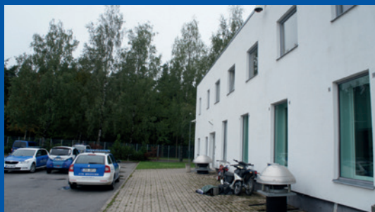
Estland. Separat indgang på bagsiden af den bygning, der huser Tartumaastøttecetret for ofre.

Tartumaastøttecetret for ofre ( Tartumaa Ohvriabikeskus ) i Estland har etableret en separat indgang på bagsiden af bygningen for særligt traumatiserede børn. Nogle retslokaler i Finland har også separate indgange, og separate indgange og ventesale er meget værdsatte aspekter ved domstole i Det Forenede Kongerige.