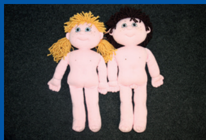
Tallinn, Estland. Dukker, der anvendes under afhøringer af børn.